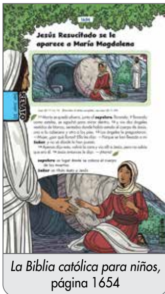
La Biblia católica para niños, página 1654