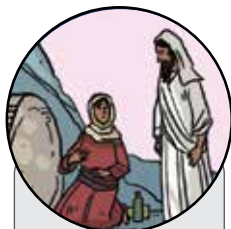
Pegatina del capítulo 1