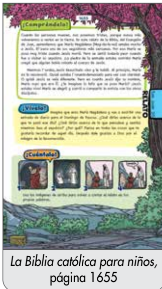
La Biblia católica para niños, página 1655