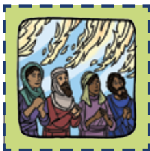
Pegatina del capítulo 1