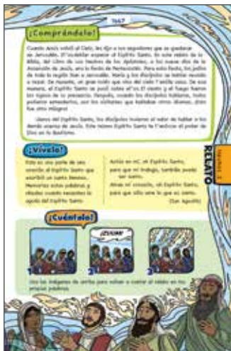
La Biblia católica para niños, página 1667