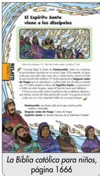
La Biblia católica para niños, página 1666