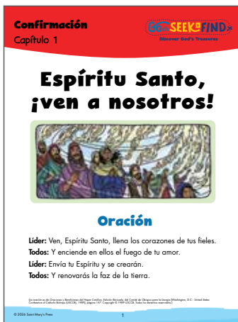
Libro de actividades, página 1